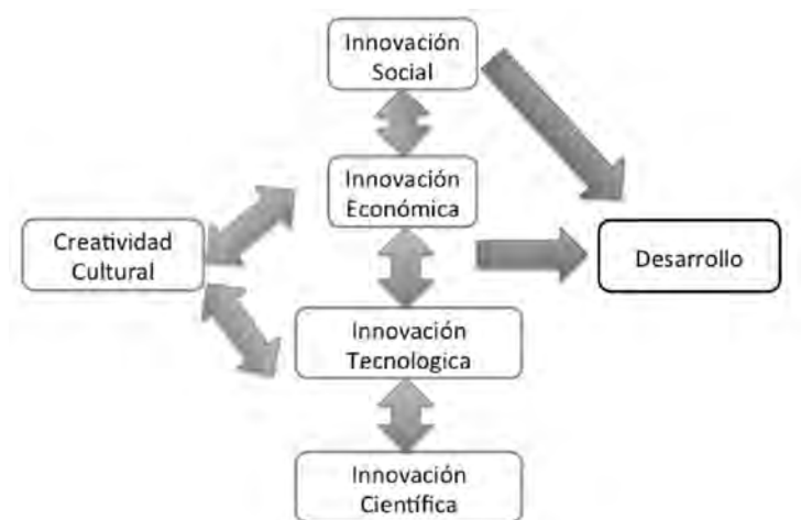
Figura 2. Creatividad cultural y desarrollo