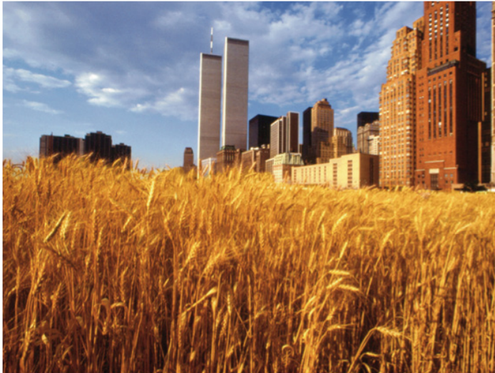
Figura 2. Agnes Denes Wheatfield - A Confrontation: Battery Park Landfill, Downtown Manhattan , 1982. (© Agnes Denes. Fuente: http://www.agnesdenesstudio.com/WORKS7.html )

sociedades industrializadas. Más bien, reflejan el iluso optimismo que fundamenta la creencia en la capacidad para construir, con la mediación de la tecnociencia, un mundo a medida de las necesidades humanas, y por ende, una mirada relacionada con la inconsciencia de sus límites 1 . La iniciativa “Land Art Generator: Freshkills Park” podría ser uno de tantos ejemplos. Se trata de la transformación de lo que era el mayor vertedero del mundo en el parque más extenso de la ciudad de Nueva York, con la concurrencia de obras de arte público y sitio-específico (New York City Department of Parks & Recreation, 2014).